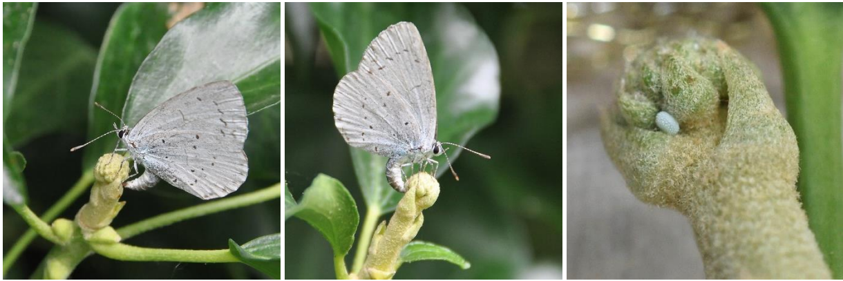
Fig. 1. Eileg van Celastrina argiolus , Boomblauwtje, op bolklimop te Waasmunster, Oost-Vlaanderen, België, 5.viii.2017.