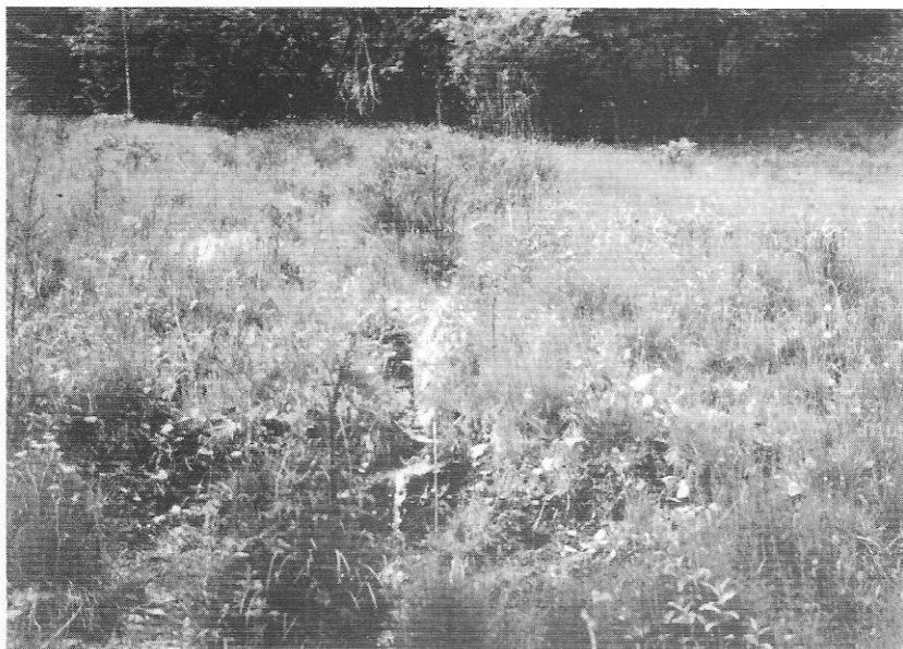
Figuur 5 : Nat biotoop te Pondel, niet ver hier vandaan vloog Hamearis lucina L.

bloemetjes van rijsbes ( Vaccinium uliginosum L.) en vormden een perfecte camouflage met de blaadjes en de bloemetjes van deze plant.