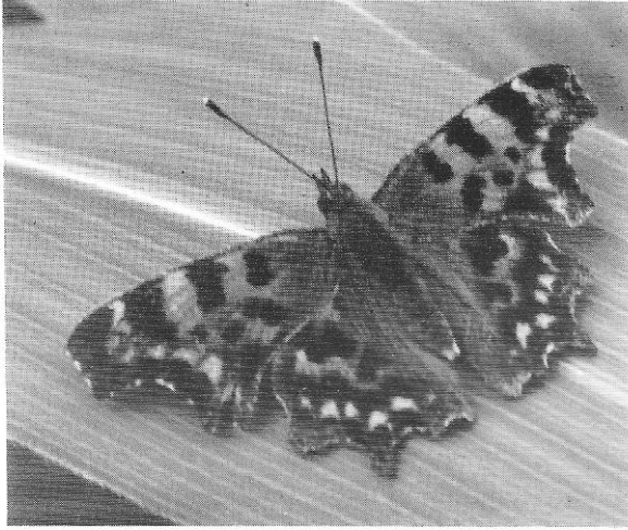
Figuur 3 : Polygonia c-album L., Cerellaz.

Eudia pavonia LINNAEUS : een mannetje te Vens op 31 mei, overdag.