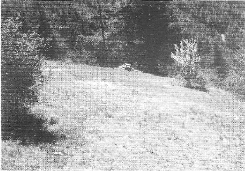
Figuur 1 : Col du Joux, biotoop van Euchloe ausonia HÜBNER.

Erebia triaria DE PRUNNER : op veel biotopen gezien, het meest te Vens, daar zeer gewoon op een hoogte van ca. 1750 m. Op ca. 1900 m waren de vlinders massaal. Ook te Lillaz en te Epinel verschillende exemplaren. De soort vliegt te Pondel meestal op de «natte» biotopen. Van alle waargenomen exemplaren waren zeker 50% afgevlogen. De meeste vlinders waren mannetjes en om verse wijfjes te vinden hebben we lang moeten zoeken. We ving een zeer klein wijfje te Quart op 31 mei.