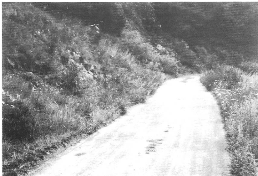
Figuur 4 : Boerenpad te Vens. Op de helling vliegt Lasiommata petropolitana FABRICIUS.