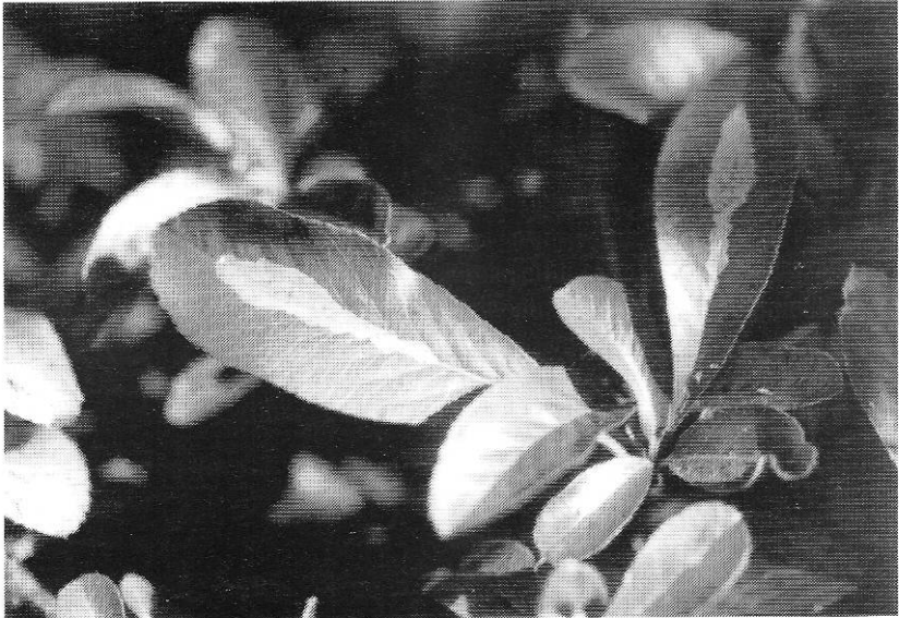
* Figuur 2: beginnende mijn van Phyllonorycter leucographella (Zeller, 1850), België, prov. Antwerpen, Berchem, 25.X.1993.