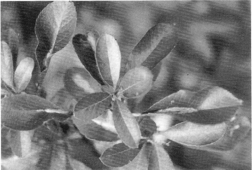
Figuur 3: volgroeide mijn van Phyllonorycter leucographella (Zeller, 1850), België, prov. Antwerpen, Berchem, 25.X.1993.