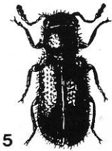
Figuur 5. Korynetes caeruleus (Degeer).

Korynetes caeruleus (Degeer) (fig. 5). Dit mierkevertje valt met zijn staalblauwe kleur minder op dan andere Cleridae. Op 17.V.1993 vond ik te Dilbeek een exemplaar op de ruit van een abri van een bushalte, gelegen tussen een park en een beukenbos. Het bleef tot nu toe mijn enige vangst van deze soort.