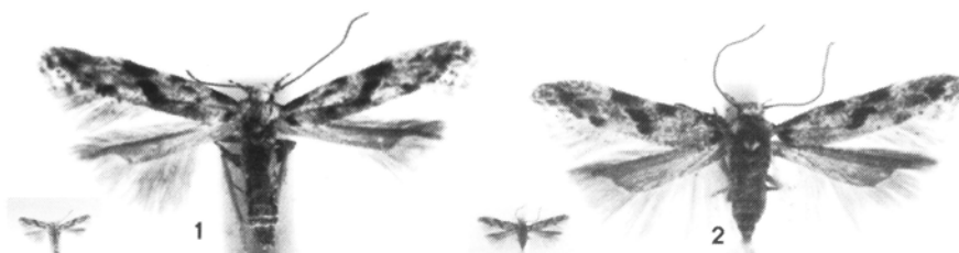
Figuur 1. Stenolechia gemmella (Linnaeus, 1758), België, Antwerpen, Schilde, Schildehof, 18.VIII.1984, leg. W. De Prins.

Een onderzoek in de verzameling van het Koninklijk Belgisch Instituut voor Natuurwetenschappen te Brussel en de privé verzamelingen van W. De Prins, B. Maes en F. Verhoeven leverde 7 vindplaatsen in België op, verspreid over 5 provincies (zie kaart 1).